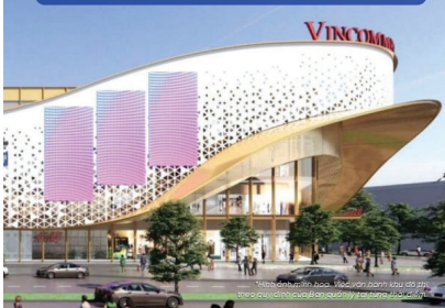
TTTM Vincom Mega Mall hiện đại quy mô hơn 3ha.