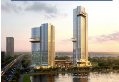
Tổ hợp khách sạn quốc tế 5 sao và văn phòng hạng A với thiết kế độc biệt dự kiến được vận hành bởi thương hiệu khách sạn hàng đầu thế giới - Marriott.