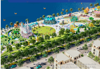
Không gian sống xanh tiêu chuẩn quốc tế với diện tích cây xanh - một nước - tới 40ha.