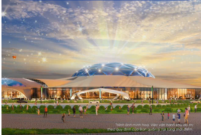
Trung tâm Hội chợ Triển lãm quốc gia - The Grand Expo với thiết kế mang hình ảnh Thần Kim Quy, lấy cảm hứng từ truyền thuyết lịch sử.